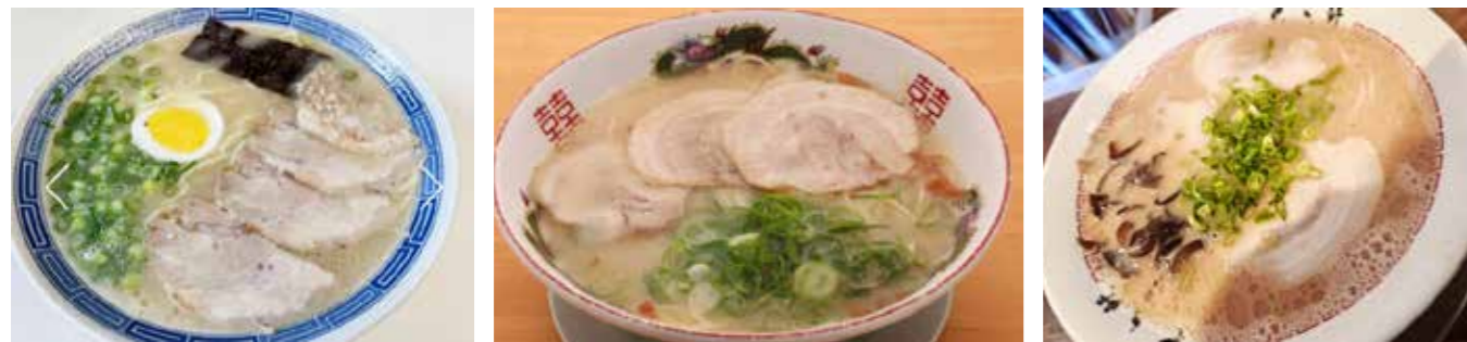
写真(左)から「沖食堂」「大栄ラーメン」「くいよい軒」「記念碑」

時のスープは透明感のある“清湯（ちんたん）”だったと言います。一般的な白濁の豚骨スープが生まれたのは、その10年後。 同じく久留米の屋台「三九」が、スープを取る際、あやまって豚骨を強火で煮立ててしまったことから偶然生まれたと言われてます。（この時店主はパチンコをしていたようです（笑））。 それ以降、白濁スープのとんこつラーメンが九州各地に広がったのです！！